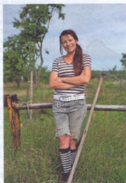
Občas padne kosa na kámen.