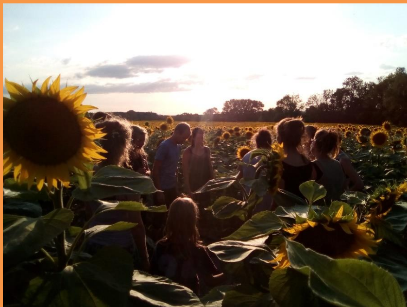
Prostředí mimopražské rezidence BDŠ vs Středočeském kraji, kde Spolek Budil úspěšně organizuje kulturní aktivity i vzdělávání metodou Jacques Lecoq.

BDŠ navštěvují studenti z celé ČR i jiných zemí. Zastává významné místo ve svém oboru činnosti především proto, že metodu Jacques Lecoq vyučuje jako jediná v ČR i na Slovensku.