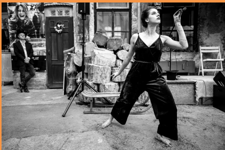
Na festivalu Múzy na Valech mohou své umění nabídnout také absolventi Budilovy divadelní školy.

Hudba pestrých žánrů, divadlo, tanec, cirkus, slam poetry, výtvarné stánky, ohňová show, literární koutek, noční kabaret a celý prostor nymburských Valů naplněný spokojenými diváky.